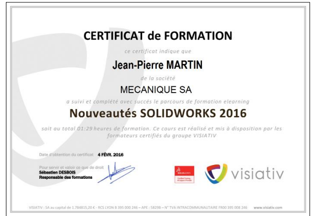
Exemple de certificat de formation sur un module